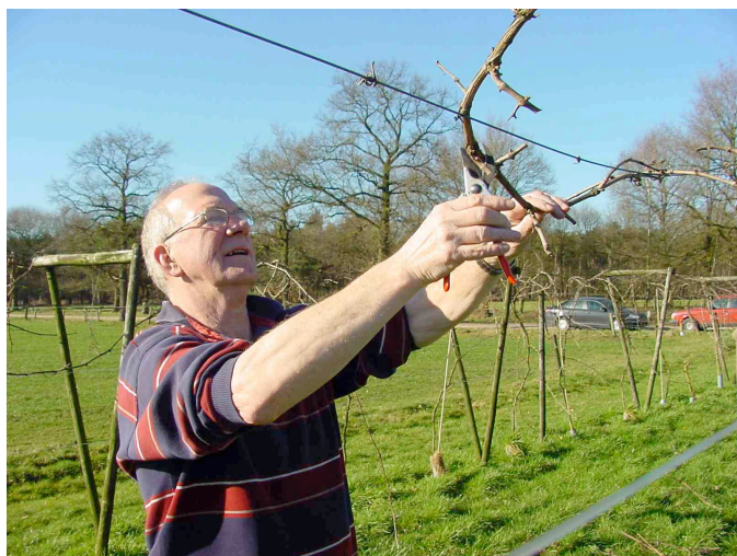
Zonnige omstandigheden tijdens de wintersnoei

De wijn heeft een aroma met veel rood fruit, waarin met name kersen mooi uitkomen. In de smaak zijn zoet, zuur en bitter goed met elkaar in evenwicht. Opvallend is de intense, kersrode kleur die veroorzaakt is door de Rondo-druif. De schillen van dit ras geven vrij snel hun kleur- en smaakstoffen af aan de wijn. De wijn is goed te drinken als begeleiding van diverse gerechten. De witte wijn is van het Riesling-type en heeft vooral frisse aroma's zoals appel, perzik en vlierbloem.