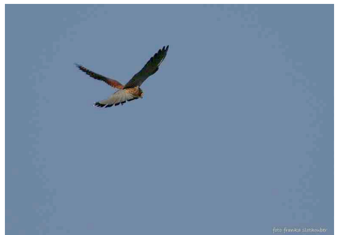
Een torenvalk kan vanaf een hoogte van 30 meter zijn prooi op de grond lokaliseren.

Overigens vangt de torenvalk voornamelijk veldmuizen, die hij zoekt door stil hangend 'biddend' boven het veld te vliegen. Bij het bidden vliegt de torenvalk tegen de wind in met dezelfde snelheid als de wind. je kunt dus aan een biddend torenvalk zien waar de wind vandaan komt: hij staat altijd met de kop in de wind.