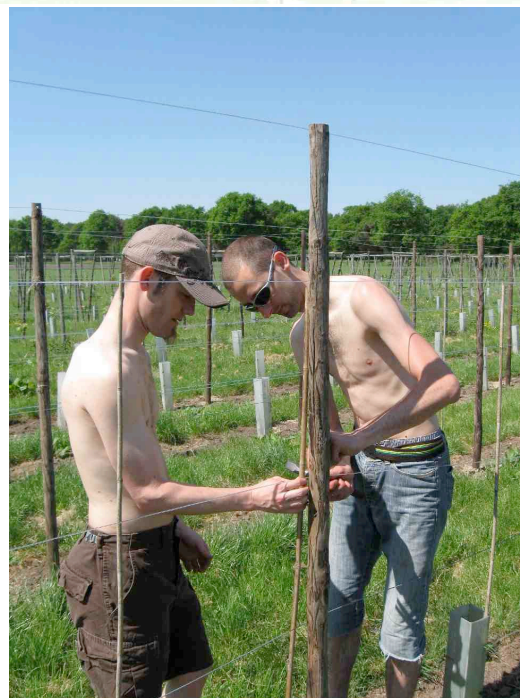
Zonnige omstandigheden tijdens de nieuwe aanplant

Terwijl de wijn nog rustig lag te rijpen, hebben wij het afgelopen voorjaar arbeidzaam doorgebracht. Gelukkig met diverse helpende handen; zo heeft Wijnmaakgilde het Waterslot 's winters mee gesnoeid. Daarnaast hebben we in mei op ons 'evenemententerrein' (waar vorig jaar onze open dag was) met diverse hulpkrachten 300 nieuwe druivenstokken aangeplant. Het wijndomein Steenvoorde is nu compleet.