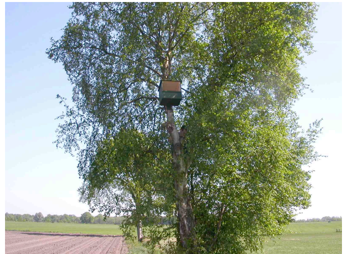
De nestboom op de hoek van de wijngaard; in dezelfde boom broeden ook een aantal zangvogeltjes.

In tegenstelling tot buizerden laat de torenvalk zich niet wegjagen door eksters en kraaien...maar omdat er bij ons in de buurt geen eksters en kraaien zitten 'moet de berg maar naar Mozes komen', dus hebben we zelf maar een exemplaar opgehangen (zie Nieuwsbrief 6). Voor de duidelijkheid: dit hebben we niet alleen maar gedaan omdat we zo van torenvalken houden, maar ook omdat we stiekem hopen dat ze ons kunnen vrijwaren van al teveel lijsters en spreeuwen. Als die eenmaal een wijngaard ontdekken kunnen ze zo de meest zichtbare druiven van een gaard wegeten.